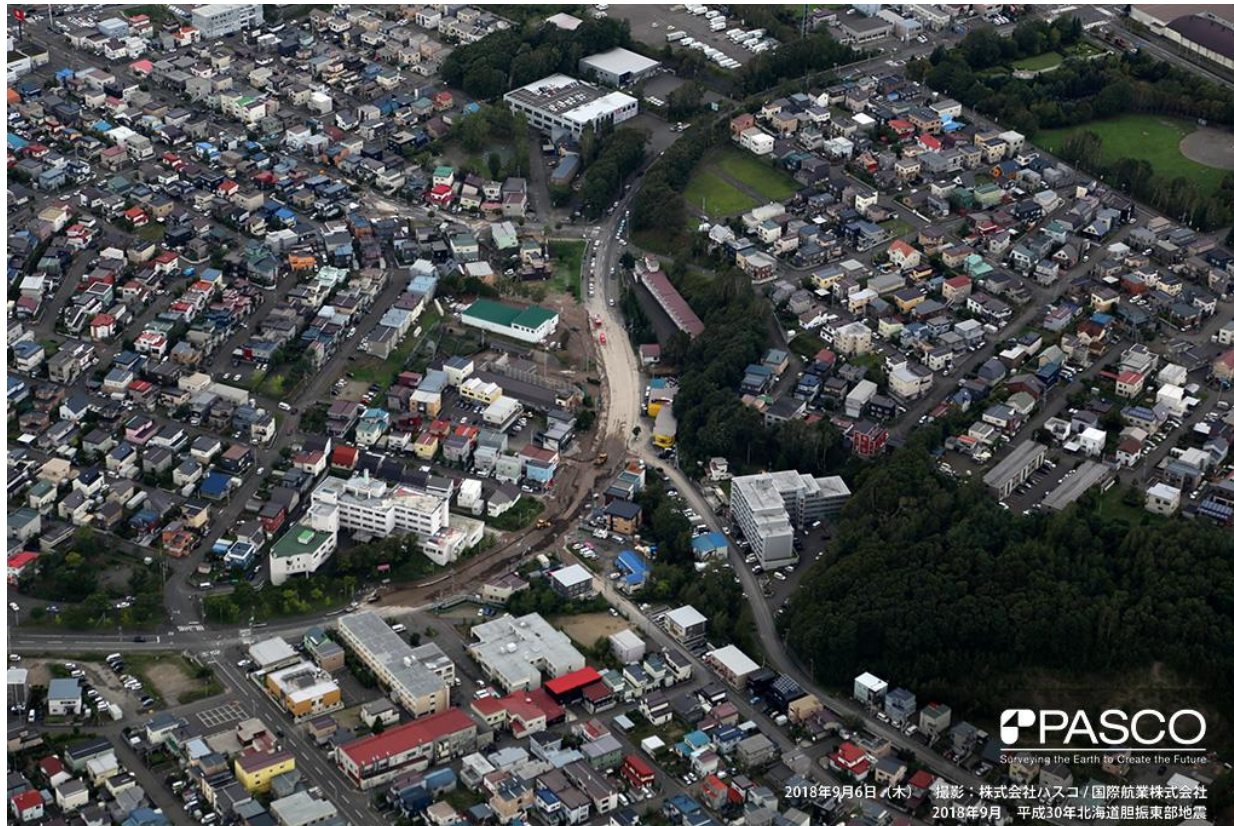
斜め写真による噴砂発生域